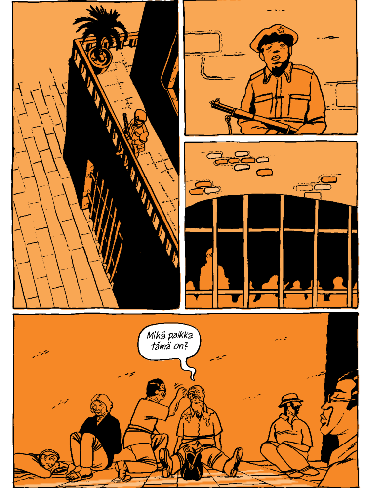
PAHOLAISEN KUISKAUS © Ilpo Koskela

Esimerkki Paholaisen kuiskaus -albumista. Vasemmanpuoleisella sivulla näytetään tapahtumapaikka, harjanteen päällä oleva linnoitus. Linna, oikean reunan palmut sekä etualan autot, rakennus ja viidakon reuna ovat kaikki perspektiivissä.